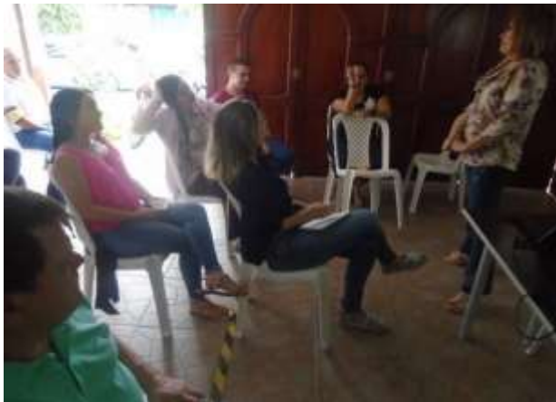
Inducción-Reinducción Sistema de Gestión de Seguridad y Salud en el Trabajo (SG-SST). Marzo 29 de 2019.