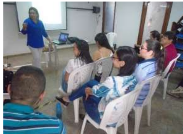
Inducción-Reinducción Sistema de Gestión de Seguridad y Salud en el Trabajo (SG-SST). Mayo 17 de 2019