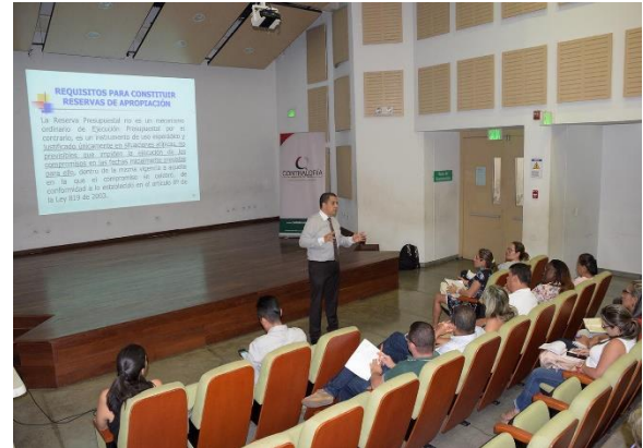
Capacitación en planeación y cierre fiscal