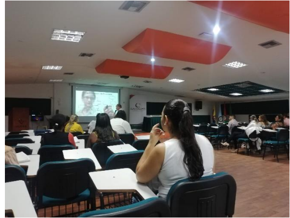
Capacitación en riesgos de gestión - corrupción y seguridad digital