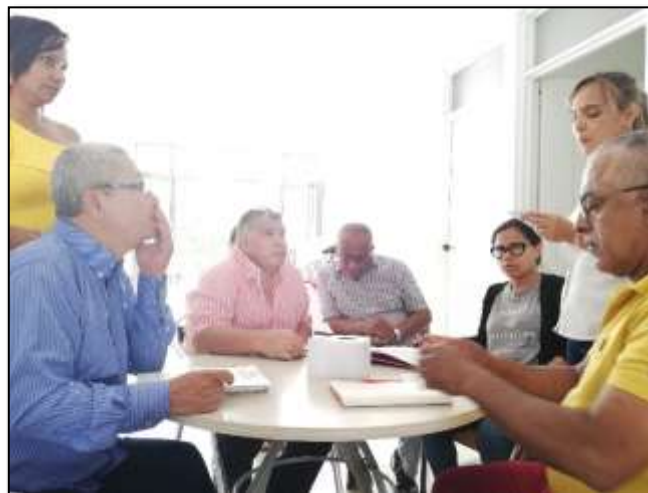
Jueves 25 y viernes 26 de julio de 2019